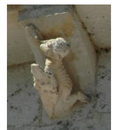
Roland (?)sonnant du cor