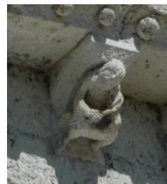
Le joueur de viole